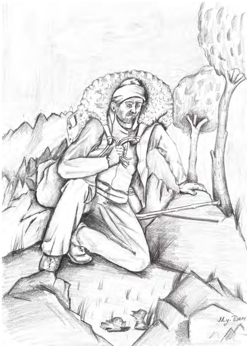
Mesela Mîda Vinîbîyayî